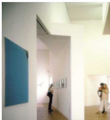
Muzea, Galerie, Kolekcjonerzy, wszyscy kochający sztukę, mogą zachwycać się jej pięknem w pełnych kolorach.

Dziś nowa technologia ochrony dzieł jest już dostępna w Polsce, dzięki wprowadzeniu przez firmę Nielsen & Bainbridge produktów ekskluzywnej linii ArtCare, takich jak kartony passe-partout, papiery barierowe, czy też szkło muzealne.