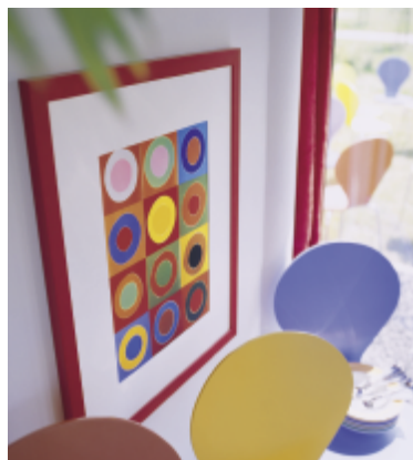
W pełni zabezpieczone dzieło, dzięki zastosowaniu kartonu passe-partout, szkła muzealnego oraz papieru barierowego do tylnej oprawy, linii ArtCare.